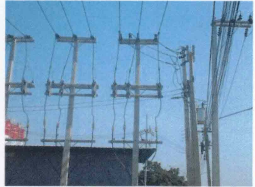
Visible Light Image